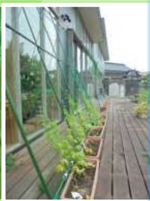
グリーンカーテン上手くできますように☆彡