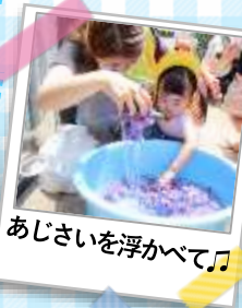
あじさいを浮かべて♪