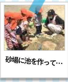
砂場に池を作って...