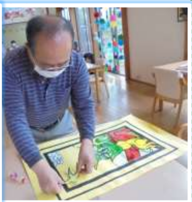
素晴らしい作品が完成しましたね！あっぱれ！