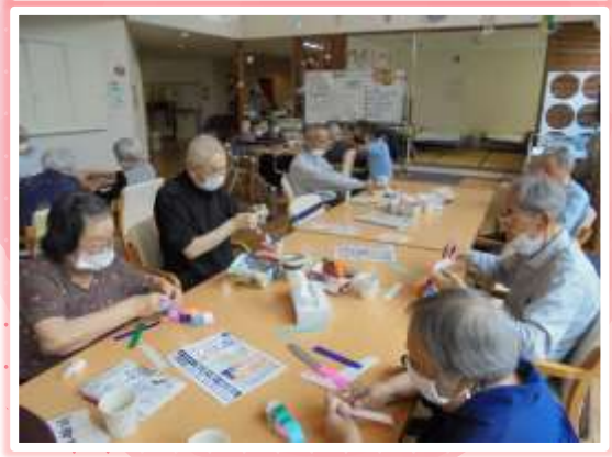
七夕飾り制作風景