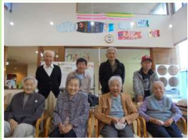
鯉のぼりの前で、はいチーズ！

皆様が一生懸命作っていただきました！ 屋外掲示板に展示していますので 近くに来られた際は是非ご覧ください！