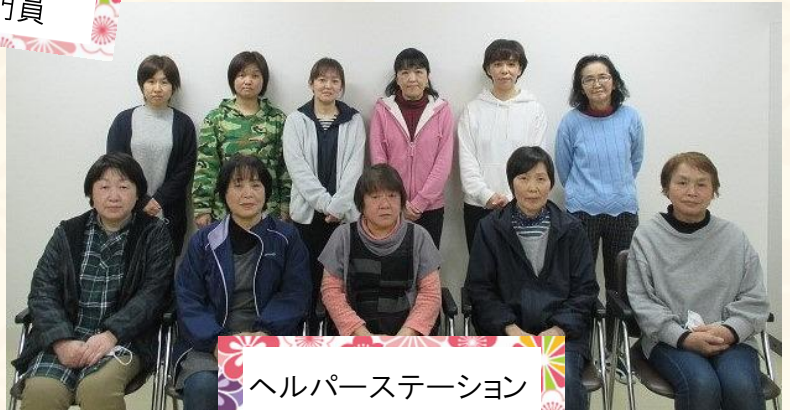
ヘルパーステーション