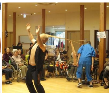
THE☆ストッキング相撲