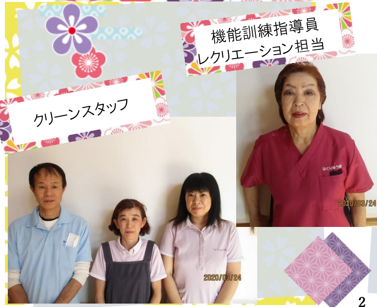
クリーンスタッフ