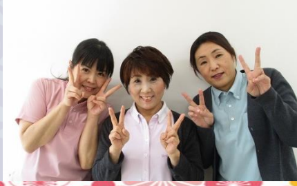
ケアマネジャー・介護主任・介護相談員