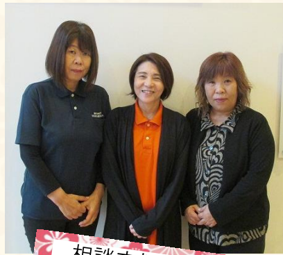
相談支援専門員 介護支援専門員

ご自宅を主として、様々な住宅環境の中でも、穏やかに日常生活を過ごして頂ける様に相談を受け支援を行っています。