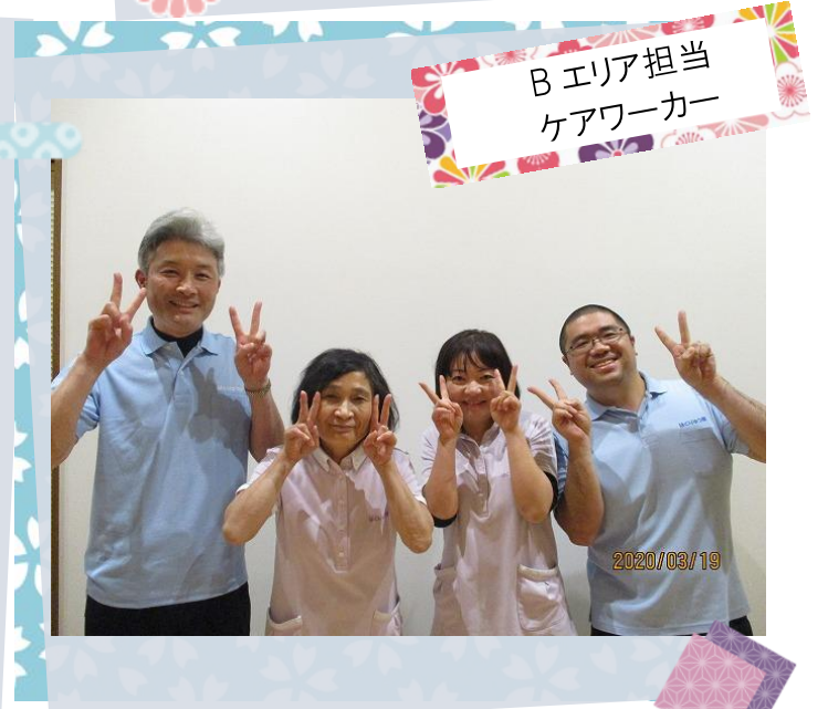
B エリア担当 ケアワーカー