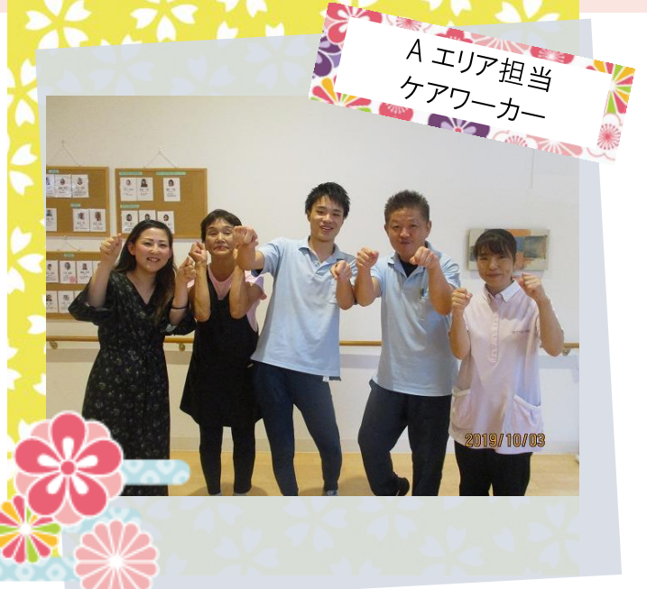
A エリア担当 ケアワーカー