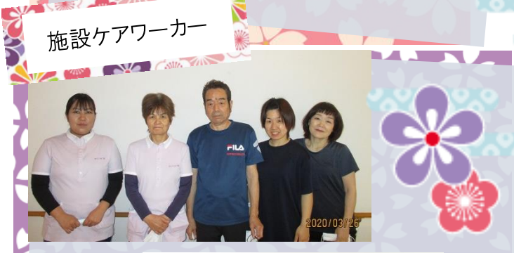
施設ケアワーカー