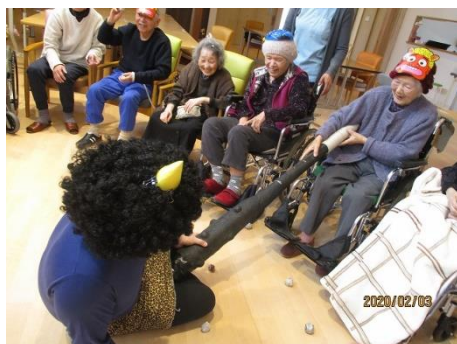
みんな笑顔で 鬼退治！！