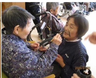
羽根つき 「私がキレイにしてあげる♡」