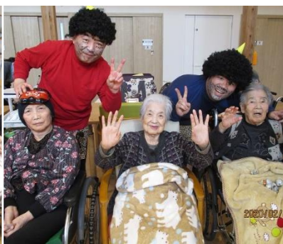
鬼と仲良く記念撮影♡