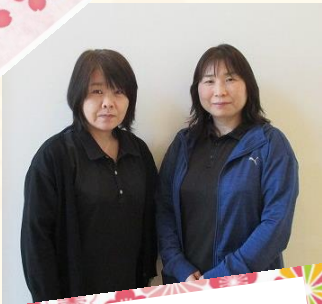
ヘルパーステーション