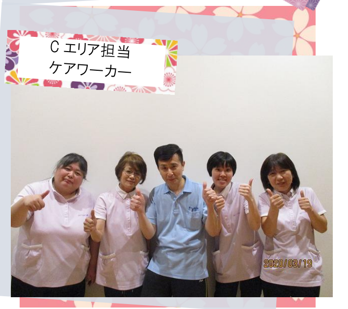
C エリア担当 ケアワーカー