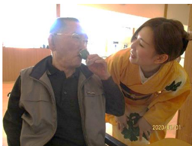
お屠蘇 美女を肴に一杯